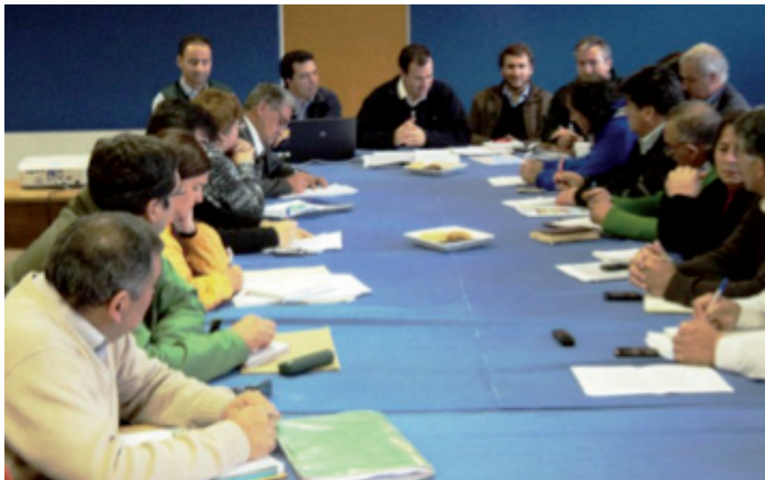
Reunión con el subsecretario Cruzat

El 6 de abril de 2012, fue firmado el acuerdo entre el Movimiento Social por la Región de Aysén y el Ministerio de Agricultura representado por el subsecretario Álvaro Cruzat, junto al seremi Raúl Rudolphi, y los directores regionales de Indap, SAG y Conaf.