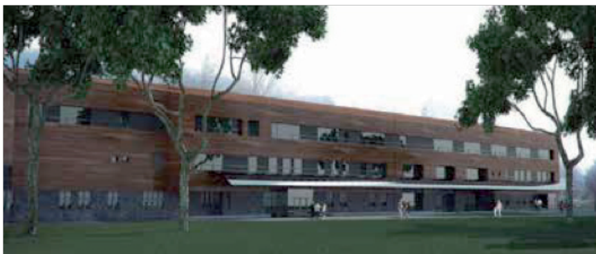
Proyecto nuevo Hospital de Puerto Aysén