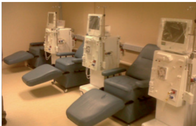
Nueva Unidad de Hemodiálisis en el Hospital de Puerto Aysén