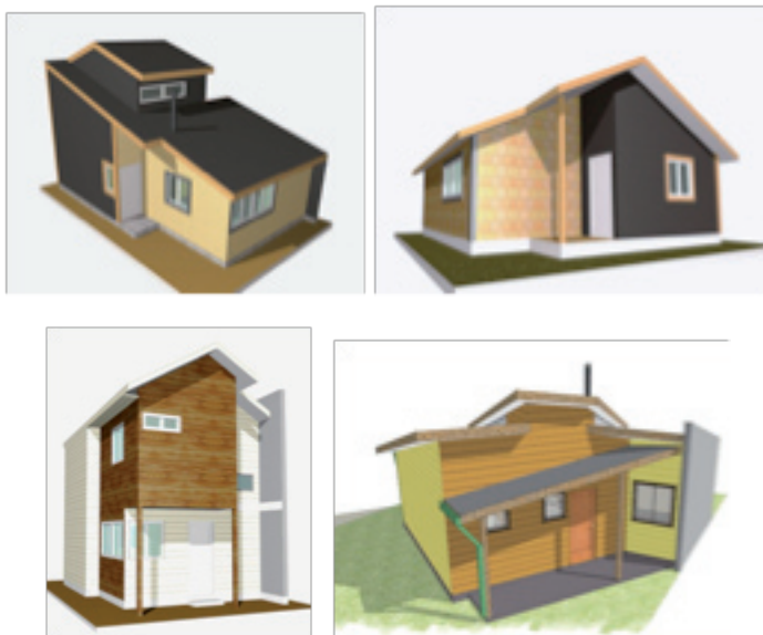
Diseños de los 4 modelos de vivienda patagónica