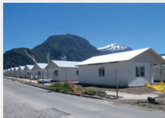
Conjunto habitacional para las 24 familias del comité “Golpeando Puertas por un Futuro Hogar”, de Puerto Aysén